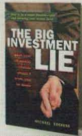
MICHAEL EDESESS BERRET-K PÁGS. 312