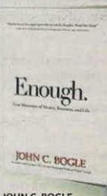
JOHN C. BOGLE WILEY PÁGS. 256