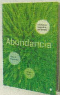
VARIOS AUTORES ANTONI BOSCH EDITORES PÁGS. 488