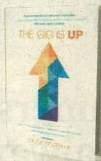
OLGA MIZRAHI GREENLEAF PÁGS. 173

• ¿Cómo emprender negocios que soporten de forma paralela y solidaria a comunidades?