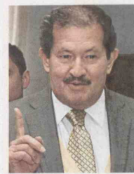
Garzón dice que no tiene ofertas políticas todavía.

Ayer, la canciller María Ángela Holguín lamentó la renuncia de Garzón a la embajada en Brasil. "Creo que habría hecho un gran papel", comentó.