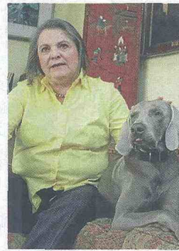
Clara López es la candidata a la Presidencia por el Polo Democrático y la Unión Patriótica.

Nosotros plantearíamos a partir del 7 de agosto incorporar una mujer representante de las víctimas, no en el cuarto de atrás sino en la mesa de negociación y una representación de las organizaciones sociales.