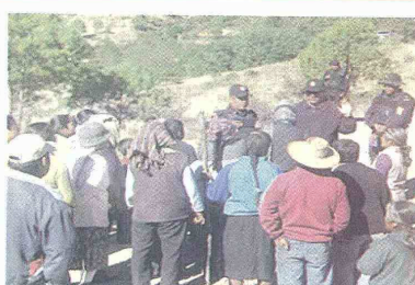
Un grupo de manifestantes retuvieron ayer a 24 policías en la vía antigua que conduce de Bogotá a los Llanos Orientales. Permanecen en el sitio conocido como Buena Vista, donde además atravesaron 25 tractomulas que bloquean la movilidad en la zona.