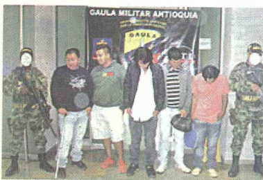
La Cuarta Brigada del Ejército Nacional efectuó la captura de cinco integrantes de la banda criminal "Los Urabeños", quienes eran requeridos por las autoridades, en un allanamiento en el municipio de Girardota, Antioquia.