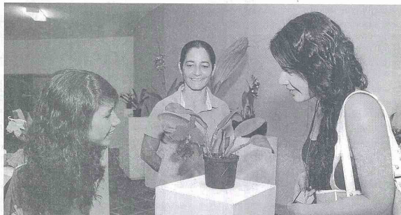
Estas muestras se encuentran en distintos puntos del bloque 33 de la Universidad del Tolima.

"Los puntos de exhibición son el trabajo que los investigadores, en su mayoría jóvenes, vienen realizando desde sus universidades o instituciones de investigación", dijo Esquivel.