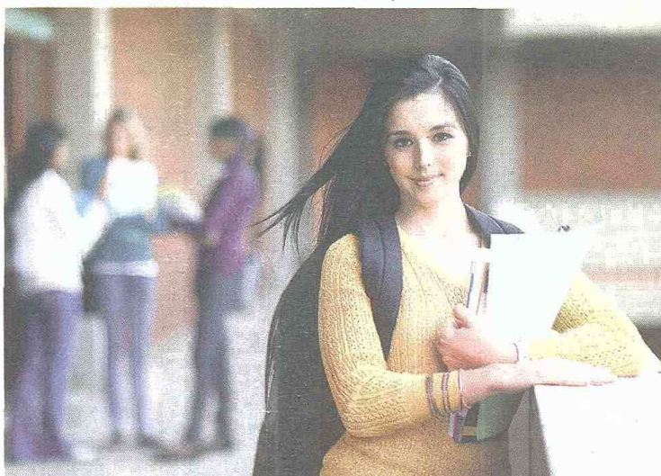
Madres cabezas de familia son quienes más buscan recursos para costear su carrera.

La directiva señala que hace dos años nació la fundación bajo la idea de patrocinar personas con excelente calidad académica, por ello establecieron una alianza con el Instituto Alberto Merani y la Universidad Nacional. Su principal foco era tratar que alumnos de las facultades de medicina, ciencias económicas e ingeniería, programas con 35 por ciento de abandono univer-