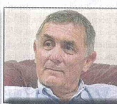
Carlos Gustavo Cano, exministro de Estado.