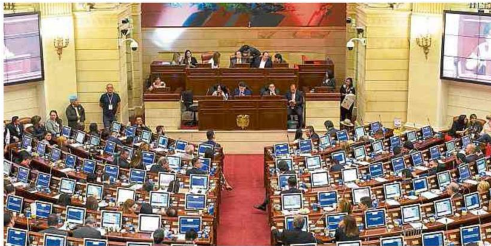
Los tiempos de trámite de los dos referendos en el Legislativo podrían coincidir con la tiempo electoral del 2022.

Cabe recordar que Uribe anunció un referendo con 12 puntos, que además de propuestas como la eliminación de la Jurisdicción Especial para la Paz (JEP), una reforma a la justicia, o la reducción del tamaño del Congreso, también tiene iniciativas de corte económico como la austeridad estatal durante seis años para mayor inversión social, una