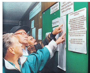
Hasta propuestas de reinsertión laboral del adulto mayor se están poniendo sobre el tapete en el debate pensional.

es el tiempo que se debe tomar para calcular la mesada que recibirá el pensionado, según Asofondos.