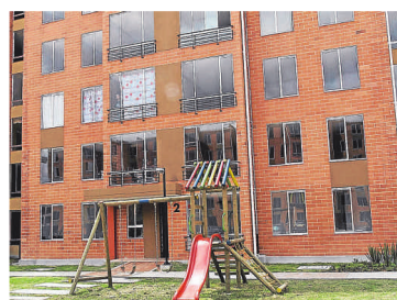
Las cesantías se pueden utilizar para compra, construcción y reparación de vivienda, así como para educación.

có que las cesantías también sirvieron el año pasado para respaldar créditos para adquisición de vivienda de interés social (VIS) por 2,95 billones de pesos.