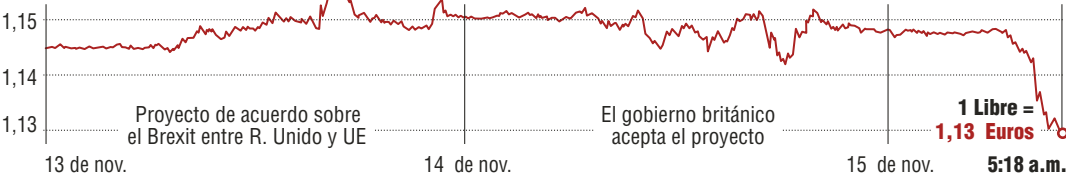
Infografía: EL COLOMBIANO © 2018. MA (N4)

LIBRA ESTERLINA Comportamiento frente al euro