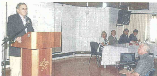
El foro «Uso del tiempo y trabajo no remunerado» se llevó a cabo en la sede principal del Sena de Bucaramanga.

Al día las mujeres trabajan en promedio 4,5 horas no remuneradas, mientras que los hombres laboran 1,8 horas en promedio sin remuneración al día.