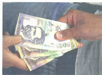
Entre 3% y 5% de incremento son las apuestas para el salario mínimo en 2013, cuya discusión empezó ayer.

La idea es que al conocer estas cifras se puedan crear políticas para incentivar la equidad entre hombres y mujeres en materia de trabajo.