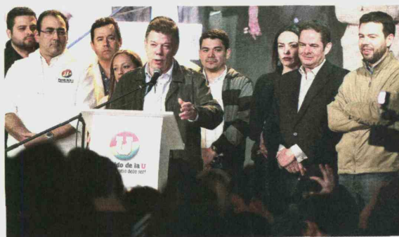
El presidente Santos se dirigió anoche a su sede de campaña cuando ya estaban escrutadas la mayoría de las mesas de votación. Lo acompañaron los partidos de la Unidad Nacional.

los artefactos del triunfo. “Quiero felicitarlos a ustedes aquí presentes y a quienes trabajaron en todos los rincones de la patria. Gracias al trabajo