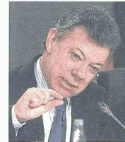
Juan Manuel Santos, presidente de Colombia.

El Gobierno de Nicaragua aún no ha reaccionado al anuncio hecho ayer en Bogotá, pero el presidente Daniel Ortega dijo el pasado viernes que Colombia «no tiene otro camino» que