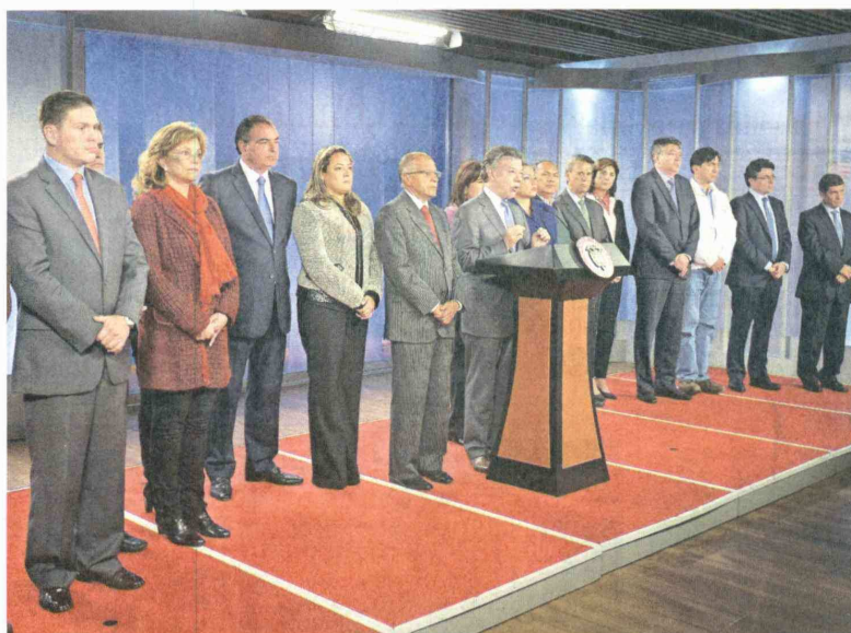
El presidente Juan Manuel Santos presentó anoche, en la Casa de Nariño, a los nuevos miembros de su equipo de gobierno.

"Lo más importante es apoyar el desarrollo normativo de los acuerdos de paz y colaborar en la construcción e implementación del modelo de justicia transicional, tanto aquí en Colombia como en el exterior", afirmó el Jefe del Estado.