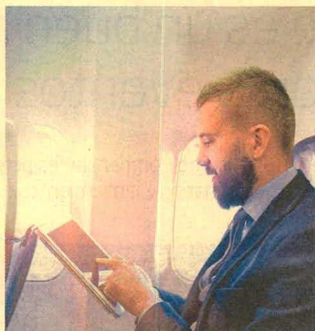
Las tarjetas personales con fotografía y código QR incorporado marcan tendencia gracias a la recordación y al reconocimiento que ofrecen.