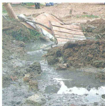
Más de un mes lleva el pozo vertiendo aguas negras, lo que tiene a los animales enfermos.

Sin embargo, el trabajo que se ejecutó por la Secretaría de Planeación, los dejó con un problema grave de salubridad pública. Lo anterior, porque el arreglo de estas calles ocasionó que se obstruyera el pozo de aguas negras que tiene la comunidad. "Cuando echaban el recebo dañaron el pozo y las aguas negras se salen. Los animales están enfermos de tomarla y