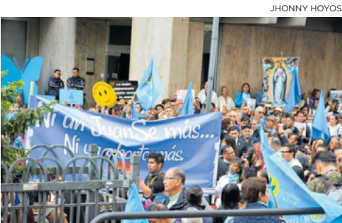
Manifestantes afueras de la Corte Constitucional rechazan la propuesta de despenalizar el aborto.

“No pretendo con esto minar la independencia de ninguna institución, pero yo creo que salirse de las tres causales, que son claras, es un cambio muy fuerte para la sociedad colombiana”, dijo.