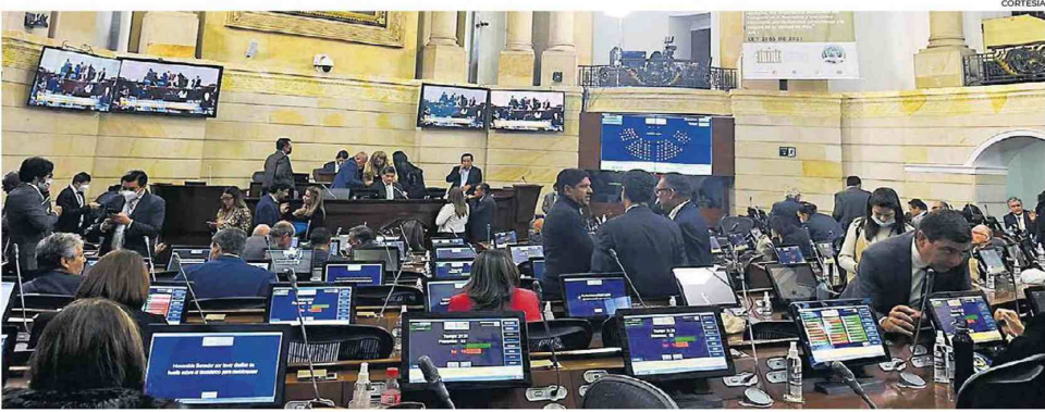
Vista de una sesión plenaria del Senado de la República durante una discusión de un proyecto de ley. El próximo Congreso se posesionará el 20 julio.