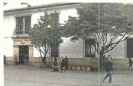
La Universidad del Rosario y otras IES del Centro se unieron para tener corredores seguros.