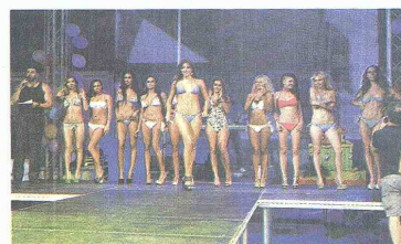
UNA de las presentaciones de la barranquillera en el certamen.

mejor ejercicio cardiovascular. Lo alterna con la práctica del king boxing y un circuito de pesas en su rutina diaria. Además del deporte, la reina colombiana cuida su figura alimentándose sanamente con frutas, verduras carnes blancas, cereales, fibra y un alto consumo de agua mineral. Miss Esthetic Internacional mide 1 m con 80 cm de estatura y sus medidas son 90-62-95.