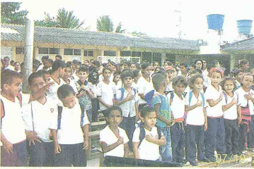
DESDE las 2:00 de la tarde en la Institución Educativa Distrital Pinar del Río comunidad del corregimiento de Juan Mina, se realiza Casas al Parque, en donde además de talleres de artes y oficios, los niños, jóvenes y adultos podrán acceder a más servicios gratuitos.

Barranquilla, Sábado 3 de Agosto de 2013