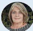
Ministerio de Agricultura y Desarrollo Rural Cecilia López