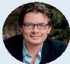
Ministerio de Educación Alejandro Gaviria