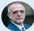
Ministerio de Defensa Iván Velásquez Gómez