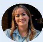
Ministerio de Salud y Protección Social Diana Carolina Corcho