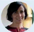
Ministerio de Ambiente y Desarrollo Sostenible Susana Muhamad