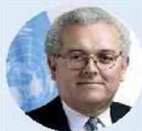
Ministerio de Hacienda y Crédito Público José Antonio Ocampo