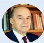
Ministerio de Relaciones Exteriores Álvaro Leyva Durán