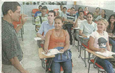
Expertos señalan que hay habilidades que no son solo tarea de la educación superior, como leer y escribir bien.