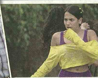
'Los 3 Caines', 'La promesa' y 'Escobar, el patrón del mal' generaron un duro debate en el país por sus contenidos.