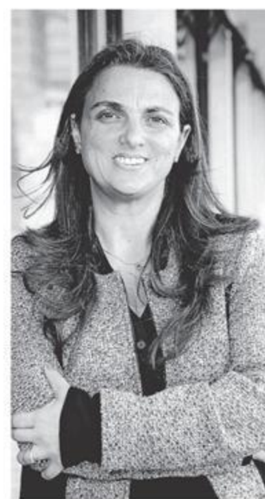
La ministra TIC, Karen Abudinen estará en la inauguración