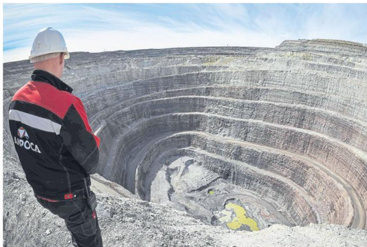
Colombia cuenta con varios acuerdos de cooperación con los EE. UU. para el desarrollo del sector minero.

El Ministerio de Minas y Energía cuenta con un memorando de entendimiento con el Departamento