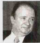
LUIS CARLOS VILLEGAS MINISTRO DE DEFENSA

"Hubo ocho heridos tras las explosiones de las sedes de Porvenir. Lo que se conoce es que se hicieron llamadas para advertir sobre los hechos y evitar que hubiese ciudadanos afectados con los artefactos".