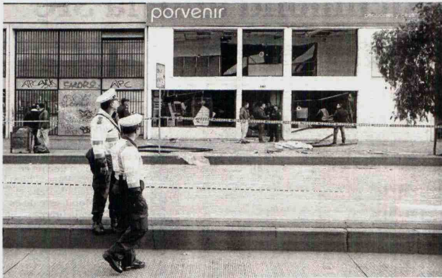
El segundo hecho ocurrió en la sede de Porvenir de Puente Aranda ubicada en la calle 13 #46 - 15.