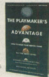
AUTORES VARIOS GALLERY BOOKS PÁGS. 320