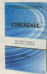
ALAN WATKINS KOGAN PAGE PÁGS. 352

NUDO QUE ATRAVIESA LA HISTORIA DE NUESTRA CULTURA