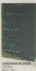
CHRISTIAN RUDDER CROWN PÁGS. 300