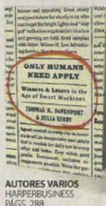
AUTORES VARIOS HARPERBUSINESS PÁGS. 288