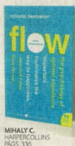
MIHALY C. HARPERCOLLINS PÁGS. 336