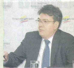
Mauricio Cárdenas, ministro de Hacienda.