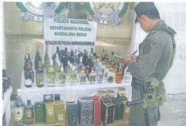
EL CONTRABANDO DE LICOR HA incidido en la reducción de las ventas de los negocios legales.

"Lo que más duro golpea al sector es la llegada de licores que provienen de paraísos tributarios como Aruba, Panamá y Margarita. Las medidas