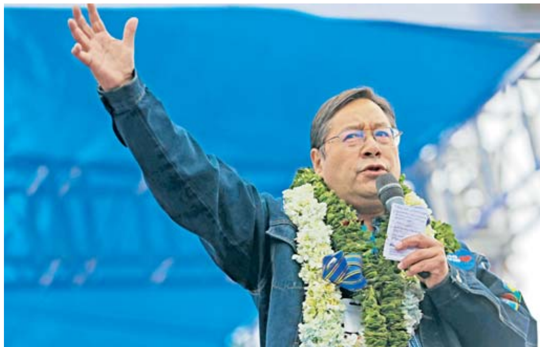
El candidato del Movimiento al Socialismo, Luis Arce, ganó las elecciones presidenciales de Bolivia. El respaldo de Evo Morales a Arce fue determinante para su triunfo.

Arce tomará las riendas de una Bolivia polarizada, que está por cumplir un año bajo el gobierno interino de Jeanine Áñez , quien llegó al poder después de la crisis política y social de octubre y noviembre de 2019. En ese momento los comicios presidenciales fueron anulados tras un informe de la Misión de Observación Electoral de la Organización