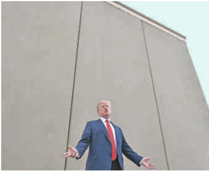
El presidente de Estados Unidos Donald Trump durante la inspección del prototipo del muro en marzo de 2018.