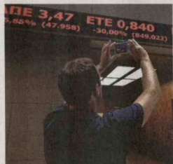
Un joven toma fotos de los indicadores de la bolsa griega tras su desplome.

El mercado preveía una recuperación difícil tras cinco semanas de cierre. Después del difícil acuerdo alcanzado el 13 de julio entre Atenas y los acreedores, las negociaciones se han reanudado "y vamos en la buena dirección", estimó el comisario europeo