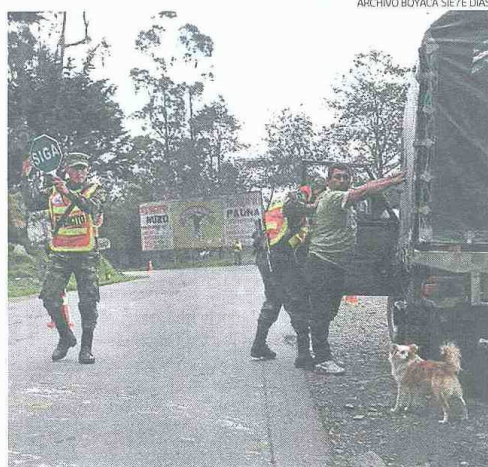
Las vías del occidente cuentan con constante presencia de soldados y policías, quienes verifican antecedentes de quienes transitan por allí.

"Seguimos con la grata noticia de que hay seguridad en el Occidente de Boyacá y que hasta hoy no hay por qué temer", recalcó el Secretario General de la Gobernación de Boyacá, quien añadió que la Gobernación construiría la vía para unir a Buenavista con La Victoria, pasando por Cooper y Muzo.