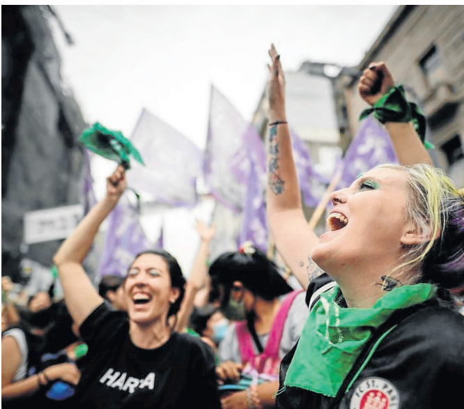
Celebraciones ayer en Buenos Aires.

Durante una sesión parlamentaria de 20 horas ininterrumpidas y con multitud de personas, tanto a favor (marea verde) como en contra (celestes), manifestándose a las puertas del Congreso, quedaron patentes las diferencias que el tema genera en la sociedad y dentro de los partidos, tanto oficialistas como opositores, aunque de antemano se preveía que, como ya ocurrió en 2018, el “sí” acabaría imponiéndose.