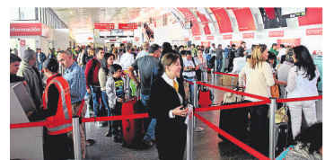
En el 2013, una protesta de pilotos llevó al plan de beneficios que dio lugar a la sentencia de la corte.

La Corte dio 48 horas a Avianca para que extendiera los beneficios del plan a los trabajadores sindicalizados y pidió que deje retornar a estas organizaciones a quienes renunciaron para acceder al plan.