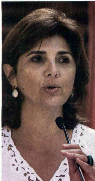
María Ángela Holguín.