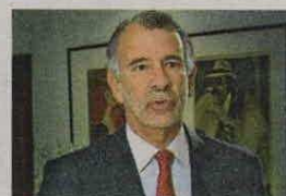
EDUARDO VERANO DE LA ROSA Gobernador del Atlántico @veranodelarosa

Aunque las bases ya están cimentadas, la implementación y consolidación de esta política supone notables retos que vale la pena destacar. En efecto, se requieren de importantes esfuerzos, inversiones e intervenciones específicas destinadas a fortalecer la cultura de datos, sumadas a la inclusión de un mayor capital humano y físico encargado de proponer e innovar. Parte también de un esfuerzo académico en donde las instituciones de educación superior introduzcan nuevas herramientas que incentiven a los estudiantes a especializarse como científicos y analíticos de datos. Finalmente, la implementación de esta política requiere de una actualización y capacitación constante, una sólida infraestructura y la armonización de la pluralidad de disposiciones normativas y jurídicas aplicables al contexto que, en su conjunto, generen unas condiciones mínimas o habilitantes para el éxito de la transformación de datos en conocimiento.