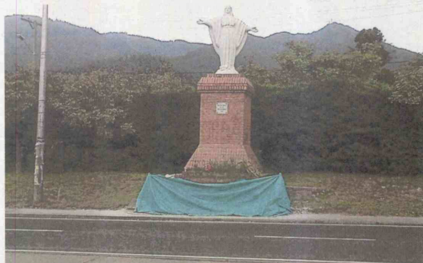
Esta virgen ubicada en el separador de la carrera 7ª con calle 110, podría ser trasladada, por obras de ampliación del espacio público. Vecinos esperan un milagro para que se quede en el lugar.

Por 70 años, el separador de la 7ª ha sido la sede de la estatua.