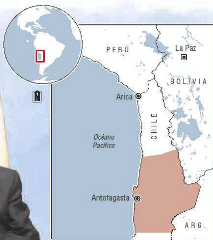
* Corte Internacional de Justicia