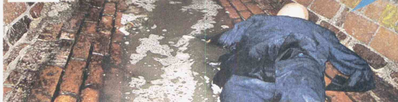
El autor del documento recreó el crimen con un maniquí artesanal. Y habla de pruebas clave que nunca aporta.