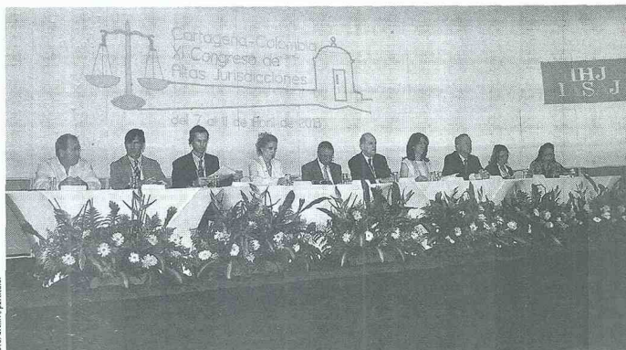
En la fotografía aparece la mesa principal del evento, encabezada por la ministra de Justicia y del Derecho, Ruth Stella Correa; la contralora general de la República, Sandra Morelli, y el presidente del Consejo de Estado, Alfonso Vargas Rincón.

La ceremonia de clausura estuvo a cargo del ministro del Medio Ambiente, Juan Gabriel Uribe, quien resaltó que la sostenibilidad ambiental es el motor de desarrollo de un país.