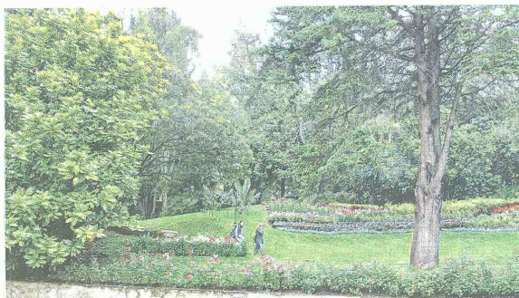
El contacto con la naturaleza, un privilegio en pleno centro de Bogotá.

la educación es muy participativo. Es una exigencia permanente: usted sabe que tiene algo bueno, pero también es consciente de que nunca se está tan bien que no se pueda mejorar. Y esa es, precisamente, la lógica de la acreditación: trabajar siempre en procura de la excelencia, del mejoramiento institucional", concluyó.