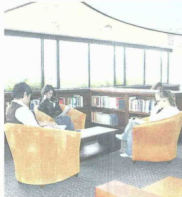
Una moderna planta física, ideal para el desarrollo integral de los estudiantes.

La acreditación es la forma en que el Estado certifica la calidad excelente de una institución universitaria. Pero, cuando uno habla de calidad extraordinaria deja un concepto demasiado amplio que no es concreto. Se trata de medir el estándar de calidad del profesorado, del currículum, de la planta física, de los programas de intercambios al exterior, etcétera. Ahí es donde uno puede empezar a ver si una universidad es buena o no. La acreditación es importante porque se trata de un examen autocrítico que después es validado por el Estado a través de los pares. Es como abrir la casa al ciento por ciento, sin tapujos, para que alguien externo confirme o desvirtúe la información que ha ofrecido el dueño. Así, por ejemplo, no basta que haya buenos profesores si los salones están mal, o que haya una buena biblioteca si el acceso a