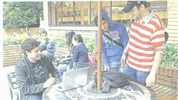
La participación de los estudiantes, vital en la consecución de la acreditación.