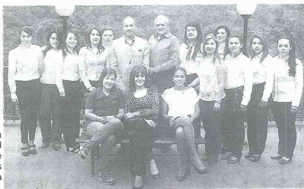
En la imagen aparece el grupo de trabajadores de Pilonieta Álvarez.

El equipo de profesionales que integra el consultorio jurídico de la Universidad del Rosario.