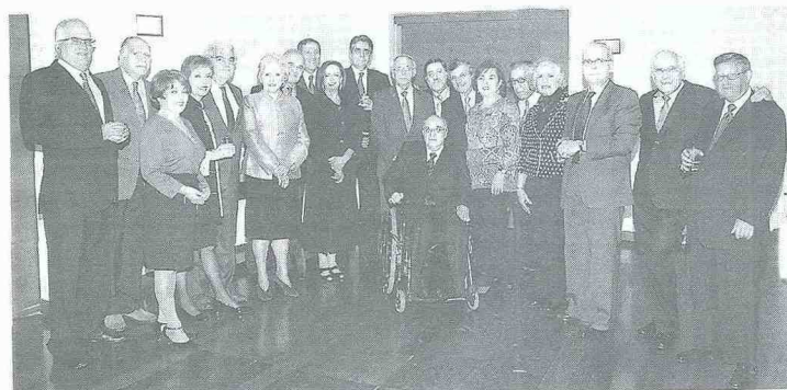
En la foto se observa al grupo de abogados egresados de la Javeriana hace 45 años.