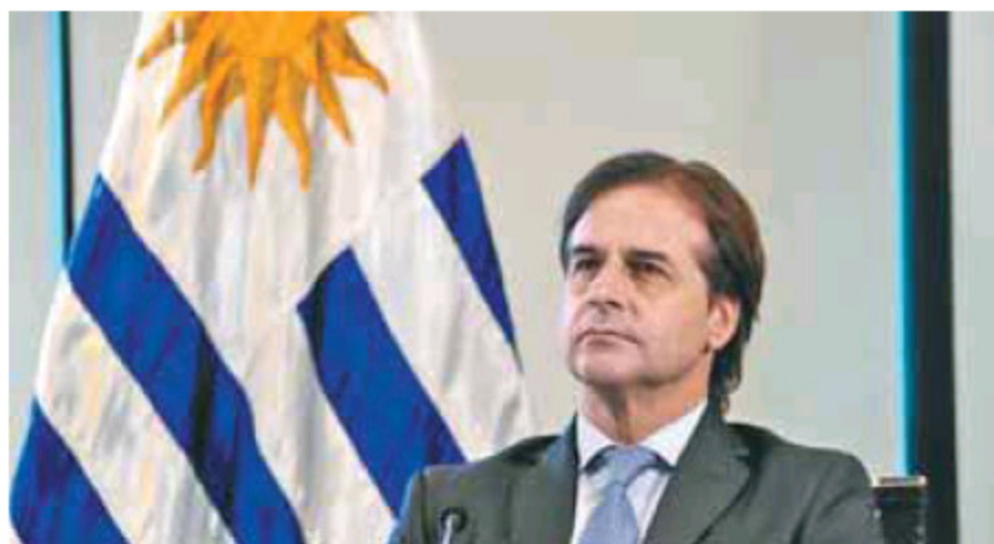
El presidente de Uruguay, Luis Lacalle Pou, atiende su primera reunión del Mercosur.