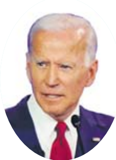
Donald Trump, Presidente de EE.UU.

“Trump está jugando con la política (...) Me gustaría ver qué dicen los científicos. Si me costara las elecciones, lo haría. Necesitamos una vacuna y la necesitamos ahora”