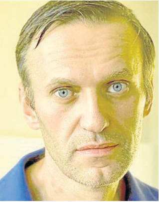
VANGUARDIA- EL NUEVO DÍA

En las protestas antigubernamentales de 2014 y 2017 murieron más de 150 civiles.