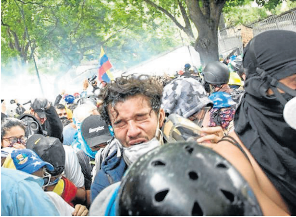
VANGUARDIA- EL NUEVO DÍA

Saab detalló que de ese total, 452 agentes están hoy tras las rejas y 127 de ellos ya fueron condenados por distintas violaciones de los derechos humanos.