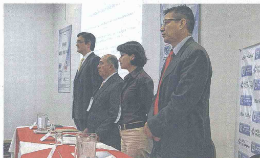
El gobernador del Valle, Ubeimar Delgado (segundo de izq. a der.) presidió ayer en Cali la presentación del plan "Visión Valle del Cauca 2032".

De igual manera, indicó que las propuestas en principio están consignadas en su programa de gobierno, pero también se deben tener en cuenta las iniciativas de los