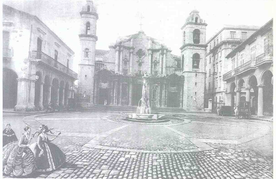
Plaza de la Catedral, en la vieja Habana.