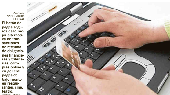
El botón de pagos seguros es la mejor alternativa de transacciones de recaudo de obligaciones financieras y tributarias, compras online y en general pagos de bajo monto en restaurantes, cine, teatro, entre otros.

Tras dos años de haber eliminado costos en productos y servicios bancarios, Colpatria reportó que entre el primer trimestre de 2018 la apertura de cuentas on line creció 1.100% frente al mismo periodo del año pasado.