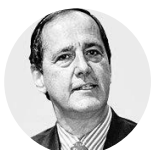
Juan Camilo Restrepo Ex ministro de Hacienda

“La inflación cero es una crisis de demanda muy seria. Para mí no ha habido reactivación económica. Esto es una crisis mucho mayor de la que pensábamos”.