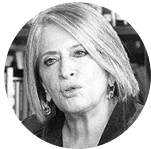
Cecilia López Exministra de Agricultura

HACIENDA. LOS ANALISTAS PROYECTAN QUE, EN PROMEDIO, LA CONTRACCIÓN SERÁ DE -15,5% Y EL FACTOR FUNDAMENTAL RADICA EN LA BAJA DE LA DEMANDA AGREGADA