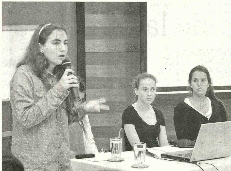
Estudiantes presentaron sus proyectos ante padres en el Centro de Fe y Culturas, el pasado miércoles.